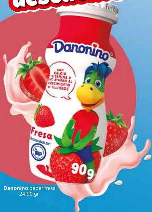
Danonino beber fresa 24-90 gr.