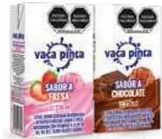
Leche Vaca Pinta fresca y chocolate 27-236 ml.