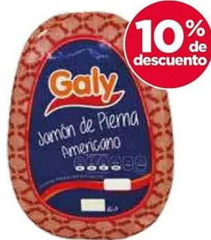
Jamón mandolina americano Galy 1-6.5 kg.