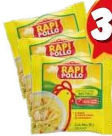
Caldo de pollo Rapi Pollo 12-88 gr.