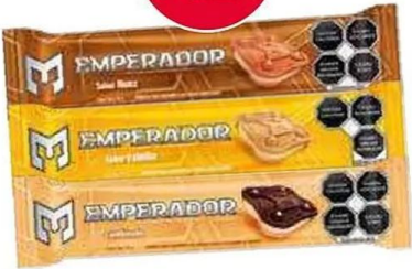
Emperador nuez, vainilla y combinado 16-91 gr (Galletas).