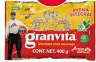
Avena Granvita 36-400 gr.