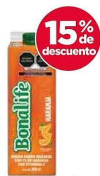
Bonalife naranja 15-900 ml Bonafina.