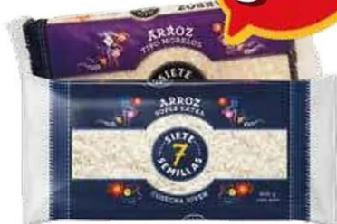
Arroz súper extra y tipo Morelos 10-900 gr 7 Semillas .