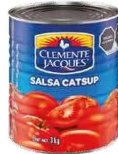
15% de descuento Salsa catsup Clemente Jacques 6-3 kg.

COMPRA 1 PIEZA DE ATÚN DOLORES AGUA Y ACEITE INST 6-1.88 KG Y LLÉVATE GRATIS 2 PIEZAS DE CAFÉ NESCAFÉ CLÁSICO BOLSA 24-28 GR.