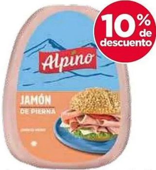
Jamón pierna mandolina Alpino 1-1 kg (6).