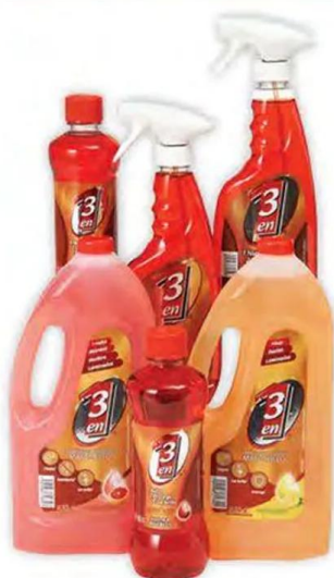
Productos de limpieza 3 EN 1