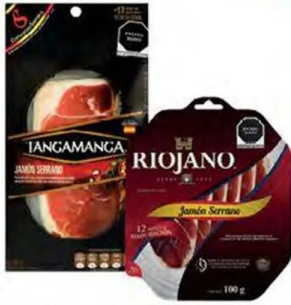
Jamones serranos empacados de origen TANGAMANGA y RIOJANO