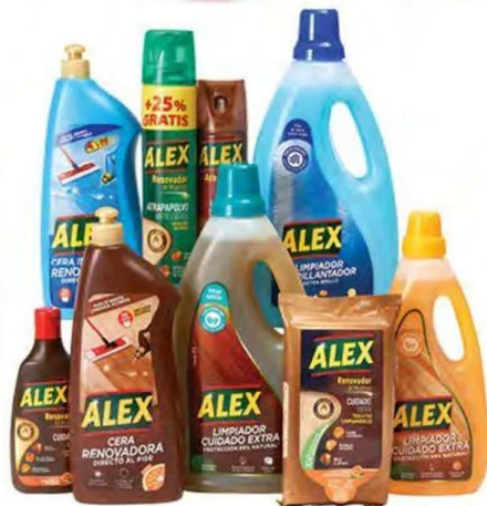
Limpiadores para madera y laminado ALEX