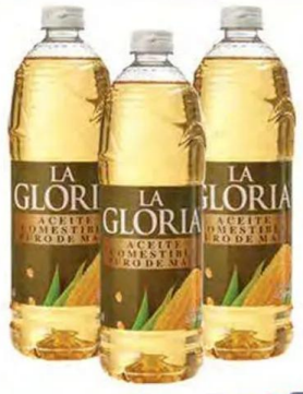
Aceite LA GLORIA