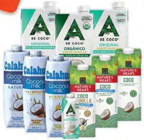
Bebidas de coco CALAHUA, A DE COCO y NATURE'S HEART del área de leche

*PAGA DOS Y TE REGALAMOS EL TERCERO DE IGUAL O MENOR PRECIO*