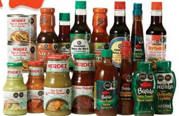
Chiles y salsas BÚFALO, HERDEZ y KIKKOMAN

*PAGA DOS Y TE REGALAMOS EL TERCERO DE IGUAL O MENOR PRECIO*