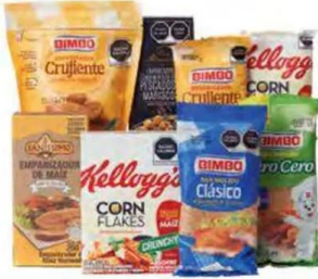
Todos los empanizadores