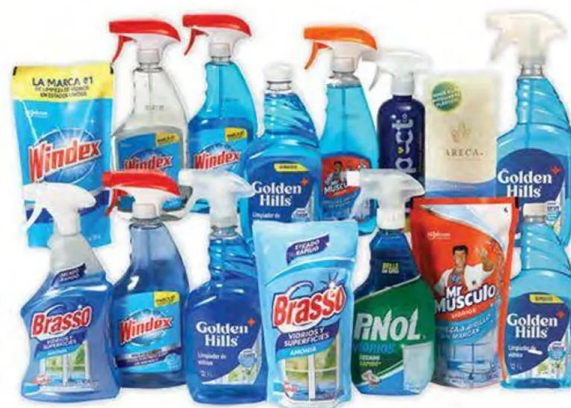
Todos los limpiadores para vidrios