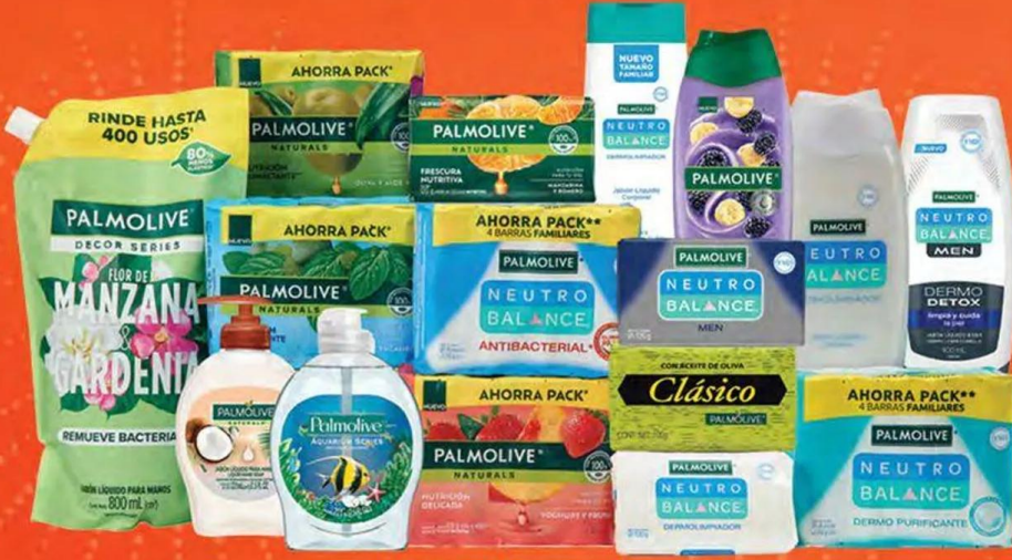
Jabón de tocador PALMOLIVE