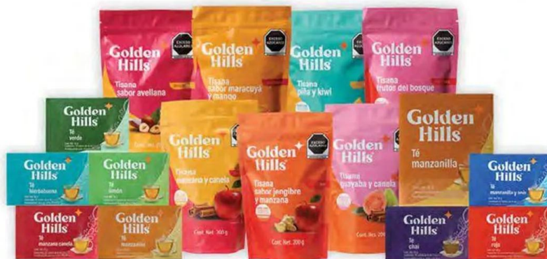
Tés y tisanas GOLDEN HILLS

*PAGA DOS Y TE REGALAMOS EL TERCERO DE IGUAL O MENOR PRECIO*