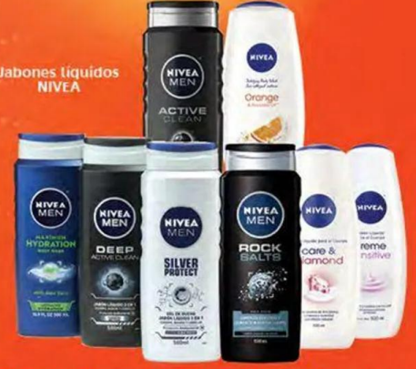
Jabones líquidos NIVEA

*PAGA DOS Y TE REGALAMOS EL TERCERO DE IGUAL O MENOR PRECIO*