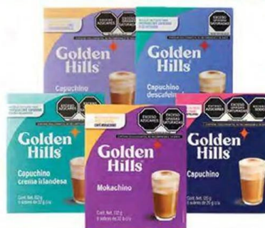
Capuchinos GOLDEN HILLS