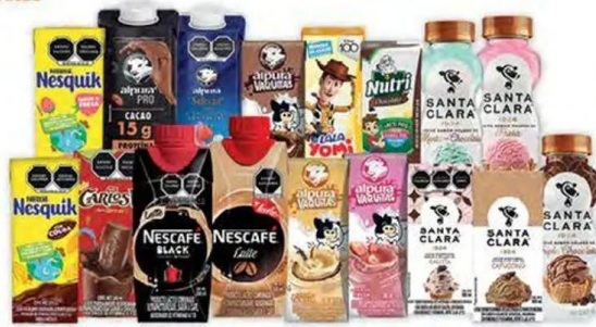
Todas las leches saborizadas individuales (300ml o mayor)