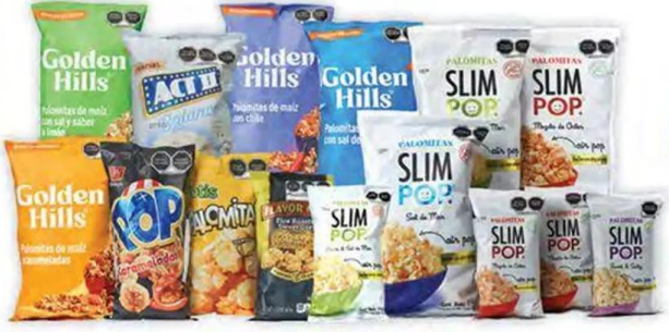
Todas las palomitas explotadas