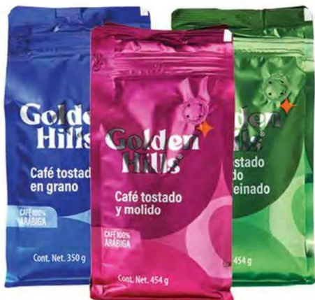
Café tostado y molido GOLDEN HILLS