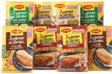
Jugoso al horno y jugoso al sartén MAGGI