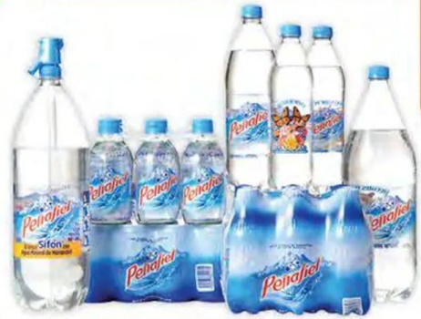
Agua mineral natural PEÑAFIEL