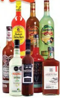
Todas las sangritas y margaritas