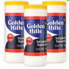
Sal en bote GOLDEN HILLS