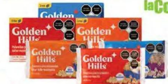
Palomitas para microondas GOLDEN HILLS