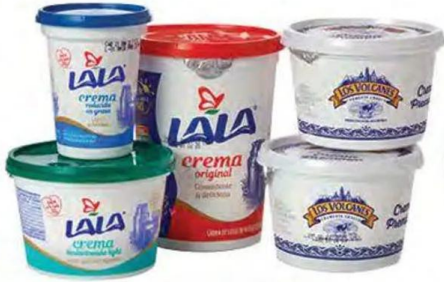
Crema LALA y LOS VOLCANES