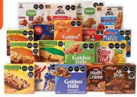
Todas las barras de cereal