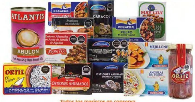
Todos los mariscos en conserva