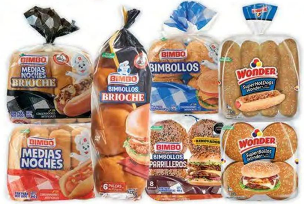
Bollos y medias noches BIMBO y WONDER