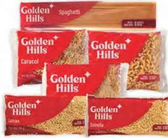
Pastas para sopa GOLDEN HILLS