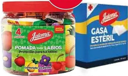
Pomada para labios 18-60 pzs y gasa 36-100 pzs Jaloma.