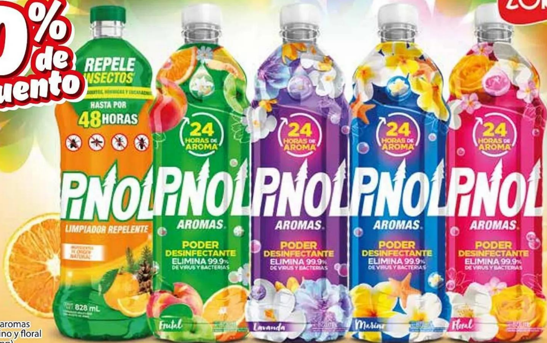
Píno! repelente, aromas frutal, lavanda, marino y floral 12-828 ml (limp).

VIGENCIA DEL 05 AL 18 DE JUNIO 2024 O HASTA AGOTAR EXISTENCIAS.