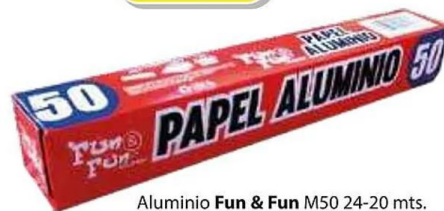
Aluminio Fun & Fun M50 24-20 mts.