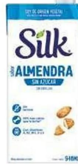
Silk alm original s/azúcar 6-946 ml.