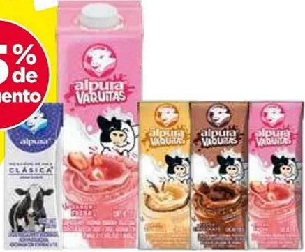
Leche Alpura natural tetra, vainilla, chocolate, fresa 24-200 ml y fresa 12-1 lt.