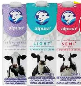
Leche Alpura deslactosada light, light y semi descremada 12-1 lt.