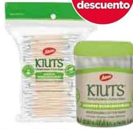
Hisopos Kiuts Jaloma tarro 30-100 pzs y 24-300 pzs.