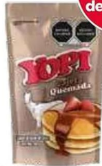
Cajeta Yopi quemada bolsa 24-250 gr.