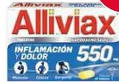
Alliviax 550 mg 10-10 tab.