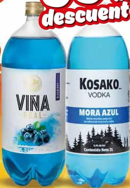
*Viña real blueberry 6-2 lt. *Kosako mora azul 8-2 lt.